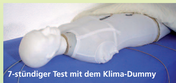
7-stündiger Test mit dem Klima-Dummy

Am EIM werden Matratzen unter realitätsnahen Bedingungen in einem klimatisierten Raum hinsichtlich ihrer wärme- und feuchteableitenden Eigenschaften untersucht. Dabei gibt ein speziell entwickelter Klima-Dummy Wärme und Feuchtigkeit an die Matratze ab – in gleicher Weise, wie das bei einem liegenden Menschen der Fall ist. Im Verlauf von 7-stündigen Versuchen werden die Wärme- und Feuchteentwicklung in der Betthöhle aufgezeichnet und anschließend bewertet.